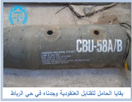
بقايا الحامل للقنابل العنقودية وجدناه في حي الرباط

(١) العقيد أحمد عبدالله الظاهري - مدير أمن المنطقة الغربية بالعاصمة أفاد المركز القانوني بالآتي: (في تمام الساعة الخامسة والنصف من صباح يوم الأربعاء وفي الوقت الذي سمعنا الطائرات الحربية لقوات التحالف وهي تحلق في سماء العاصمة وسمعنا دوي انفجارات كبيرة ومدوية، تم إبلاغنا