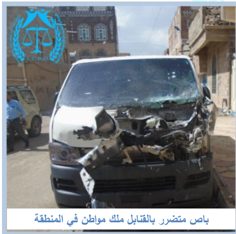
باص متضرر بالقنابل ملك مواطن في المنطقة

الرحمن - أفادنا بقوله: (أنه أثناء تأديتهم صلاة الفجر في جامع الرحمن القريب من منزله سمعنا أصوات انفجارات شديدة في سماء الحي "الحارة" فخرجنا من المسجد وإذا بالشظايا تتطاير فوقنا وفي واجهات المنازل من عدة اتجاهات، فانتظرنا بالمسجد حتى هدأت أصوات الانفجارات، وخرجنا نشاهد