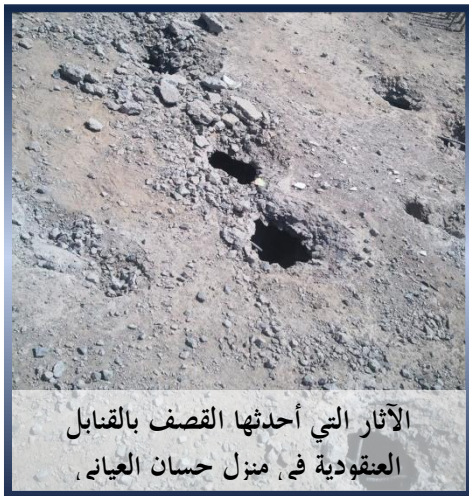
الآثار التي أحدثها القصف بالقنابل العنقودية في منزل حسان العياني،